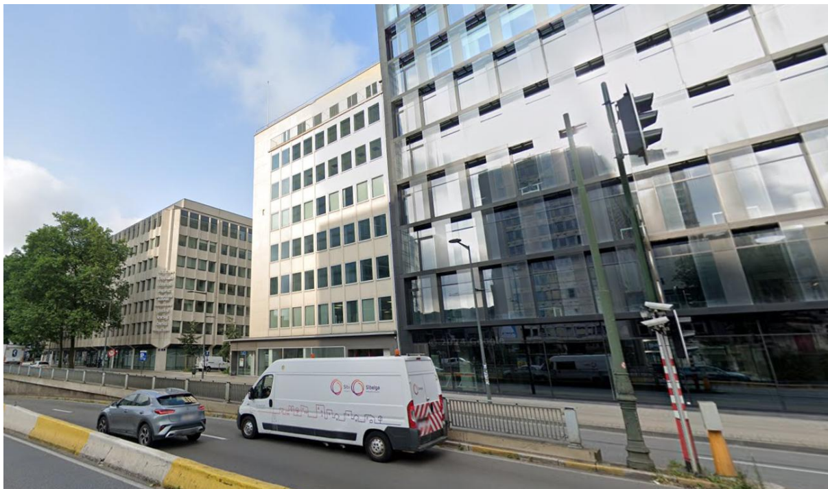
Figure 5 – Image 4