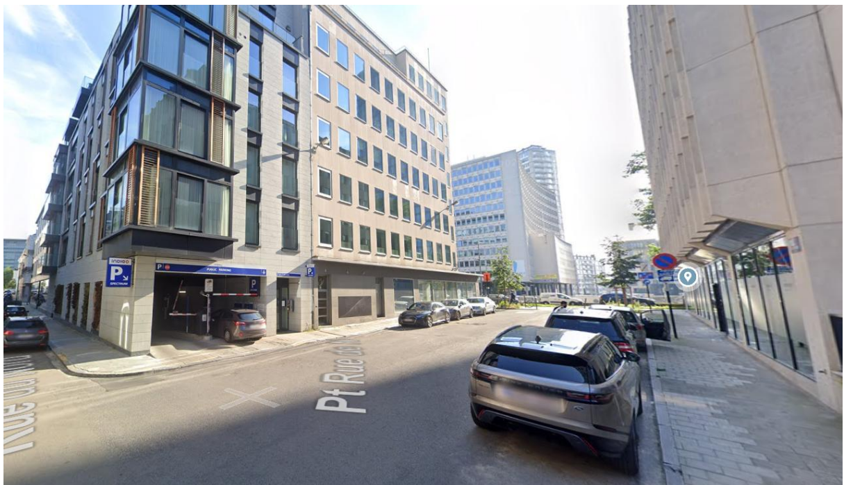
Figure 4 – Image 3