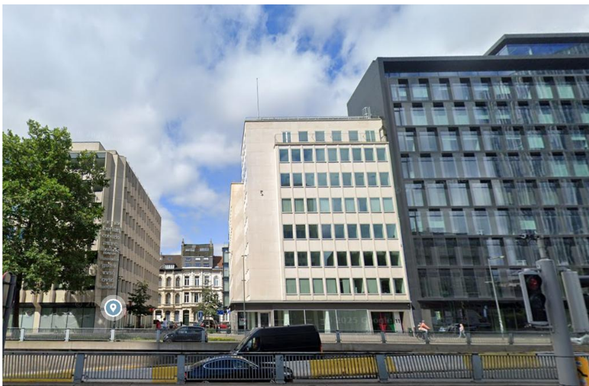
Figure 6 – Image 5