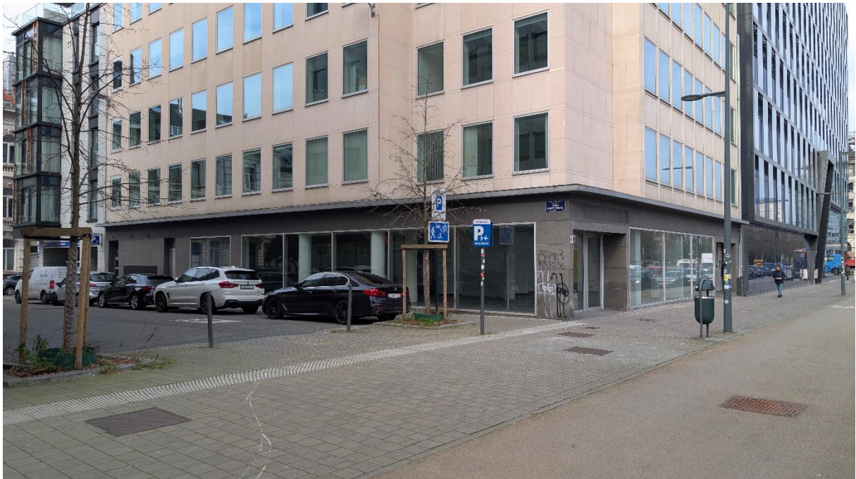
Figure 3 – Image 2