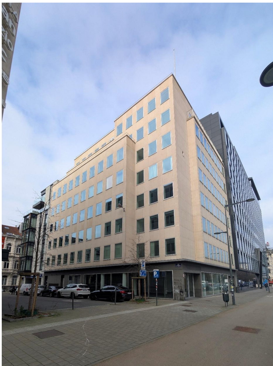
Figure 2– Image 1